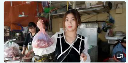
'Giá thịt lợn tăng thêm 20.000 đồng/kg và sẽ còn tăng tiếp'