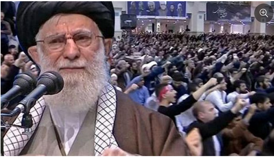
Lãnh tụ Tối cao của Cộng hòa Hồi giáo Iran Ali Khamenei

Hội đồng bao gồm 88 giáo sĩ được nhân dân bầu ra với nhiệm kỳ 8 năm, mặc dù tất cả các ứng cử viên phải được Hội đồng Giám hộ (Guardian Council, GC) phê chuẩn trước. Cuộc bầu cử Quốc hội gần đây nhất được tổ chức là vào năm 2016. Người đứng đầu hiện tại của cả Hội đồng Cố vấn về Lãnh tụ và Hội đồng Giám hộ là Ahmad Jannati.