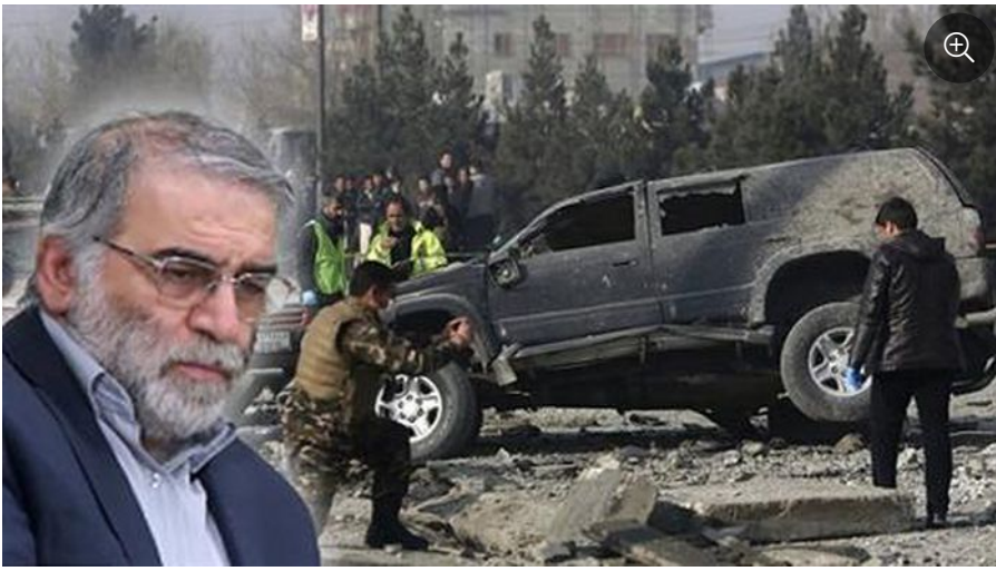
Vụ ám sát gần nhất đối với nhà vật lý hạt nhân Mohsen Fakhrizadeh (ngày 27/11/2020)

Tuy nhiên, điều khiến chuyến thăm gần đây nhất của ông Javad Zarif trở nên quan trọng nhất chính là việc hai nước ký hiệp ước an ninh.