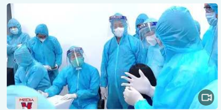
Chính thức tiêm vắc xin phòng COVID-19 ở Hà Nội