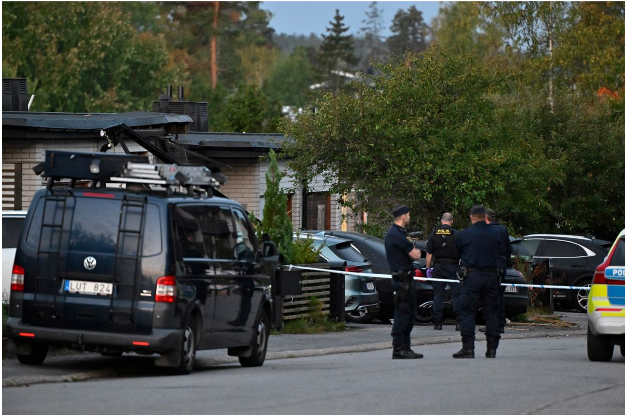
Rendőr egy lezárt útszakaszon Stockholm Hasselby Villastad északnyugati városrészében, ahol robbanás történt egy lakóépületben 2023. október 2-án

Csak szeptemberben drasztikusan romlott a helyzet Svédországban: