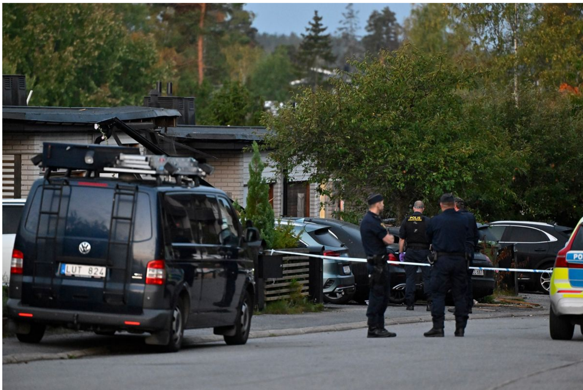
Rendőr egy lezárt útszakaszon Stockholm Hasselby Villastad északnyugati városrészében, ahol robbanás történt egy lakóépületben 2023. október 2-án

Csak szeptemberben drasztikusan romlott a helyzet Svédországban: