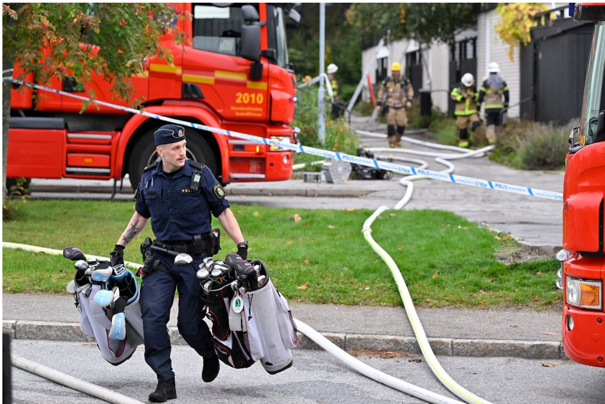
Rendőrről egy lezárt útszakaszon Stockholm Hasselby Villastad északnyugati városrészében, ahol robbanás történt egy lakóépületben 2023. október 2-án

– mondta a Svenska Dagbladet című napilapnak.