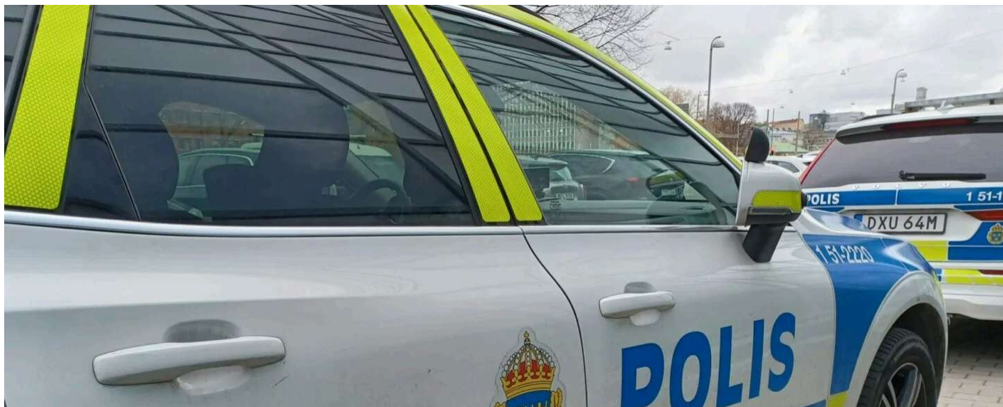
Švédská policie (ilustrační foto)